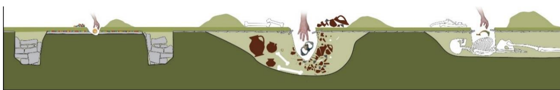
Obr. 1 – Naznačenie možnej straty informácií detektorárskou činnosťou – rovnaký nález môže pochádzať z rôznych kontextov (nášlapový horizont podlahy zaniknutého domu, výplň zahĺbeného sídliskového objektu, narušení hrovej jamy), avšak po jeho neodbornom vyzdvihnutí už nie je možné dôležité informácie späť získať.

Od rozšírenia detektorov kovov a popularizácie archeologických lokalít v laickej spoločnosti je však archeologická obec konfrontovaná s problémom amatérskych hľadačov pokladov, ktorí „vykrádajú“ známe bohaté lokality a mnohokrát aj objavujú lokality nové. Mnohých vedie rovnaký motív ako priekopníkov archeológie v minulosti – záujem o históriu či túžba nájsť „poklady“. Ich činnosť bohužiaľ veľakrát neprispieva k rozvoju odboru ani k poznaniu histórie krajiny. Veľkým problémom je hlavne strata archeologických artefaktov, ktoré pomáhajú dotvárať povedomie o histórii daného územia, rovnako závažným problémom sú však aj neodborné vyzdvihnutie nálezov, ktoré naruší nálezové kontexty a absencia profesionálnej dokumentácie, ktorá by mohla aspoň čiastočne zachytiť nálezové okolnosti. Z vedeckého hľadiska tak okrem straty nálezu dochádza aj k strate niekedy veľkého množstva významných sprievodných informácií. Názorne tento problém dokladá obrázok 1. 1